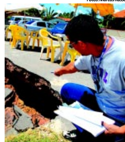
À esquerda, ruínas da calçada no final da Avenida Cabo Branco destruída há semanas pela erosão. Ontem, a maré alta voltou a atingir a pista e fez ceder outro trecho da mesma avenida