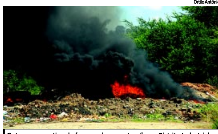
Ontem uma cortina de fumaça chamou atenção no Distrito Industrial

ram o apoio da população à Campanha Nacional, lançada ontem na Paraíba. "É necessário evitar a epidemia", declarou Padilha. PÁGINA 9