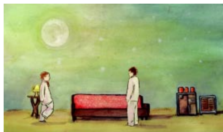
De cima para baixo, cenas dos filmes Instantâneos , Ratão , As aventuras de Paulo Bruscky e Balanços e milkshakes , outros “cartazes” do Festival do Júri Popular