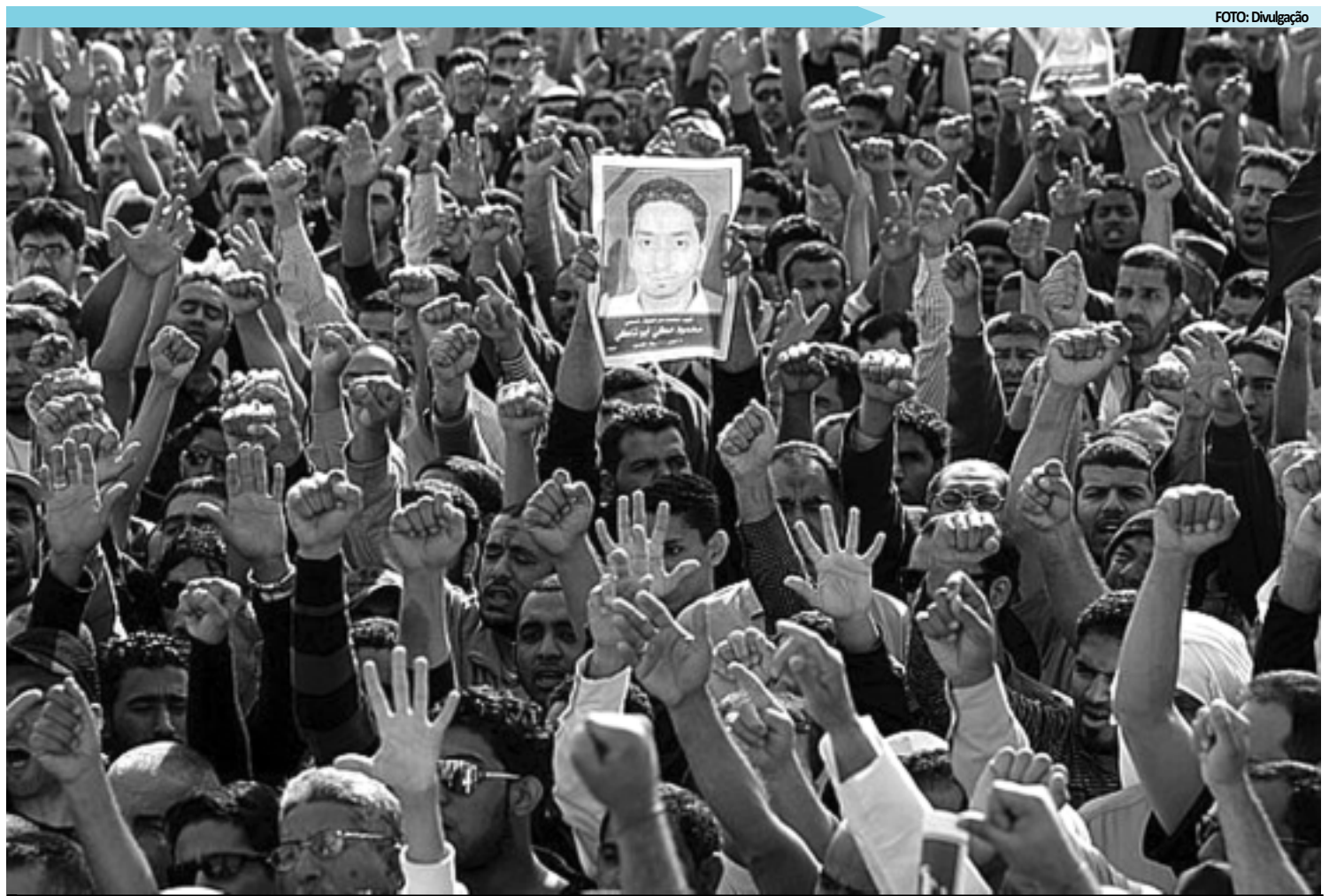
Nos funerais, os manifestantes, de maioria muçulmana xiita, pediam por democracia e pelo fim da dinastia sunita no país, comandada pela família Khalifa

Na quinta-feira, centenas de pessoas realizaram manifestações pacíficas nas ruas de Benghazi e em pelo menos outras quatro cidades, segundo a HRW. "Forças de segurança líbias atiraram e mataram manifestantes para dispersar os protestos", afirmou o grupo.