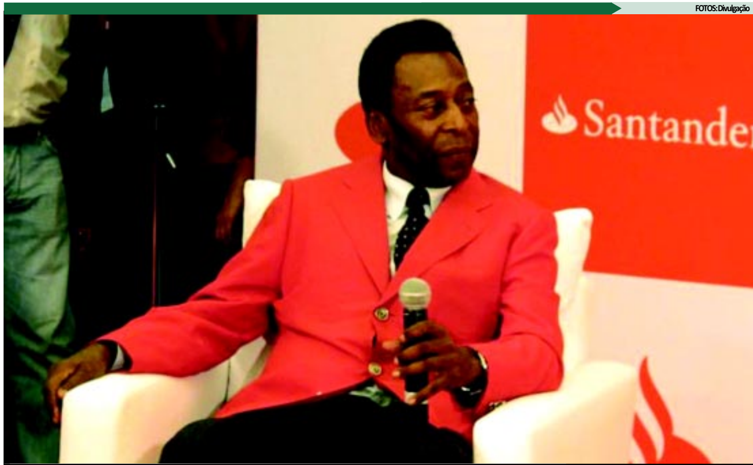
Pelé mostrou-se preocupado com a realização da Copa de 2014 no Brasil e também com a polêmica envolvendo o jogador Paulo Henrique Ganso

GANSO - Santista de coração, o Rei do Futebol mostrou-se chateado também com a polêmica envolvendo Paulo Henrique Ganso. O meia busca uma renovação de contrato com um salário melhor, assim como Neymar conseguiu no ano passado. Mas a demora na negociação fez surgirem especulações de mudança de clube. Pelé não gostou de saber disso e recla-