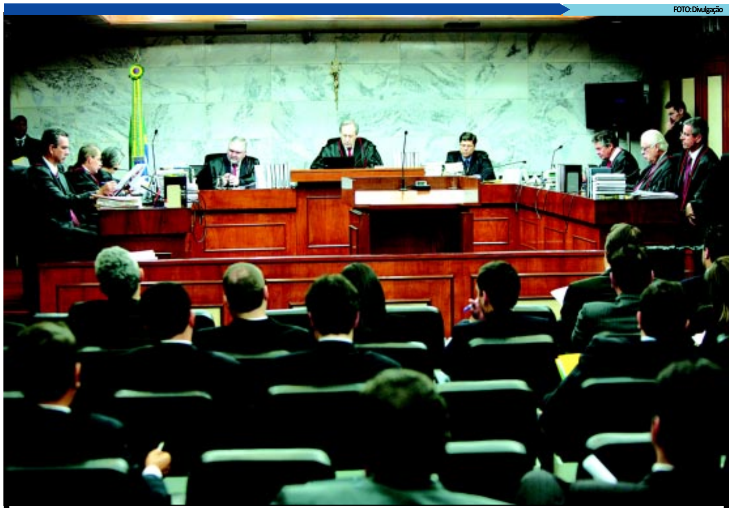
O presidente do TSE, Ricardo Lewandowski (centro), afirma que ocupação de vagas de parlamentares por suplentes deve ser rediscutida pelo Supremo

Skaf disse que, além da reforma política, todas as reformas estruturais do país são urgentes. Ele pediu que o governo se esforce para aprovar uma reforma tributária e trabalhista no Congresso Nacional o mais rapidamente possível.