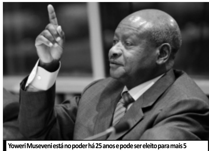
Yoweri Museveni está no poder há 25 anos e pode ser eleito para mais 5

"O Egito concordou em permitir que dois navios de guerra do Irã atravessassem o Canal de Suez", reportou a agência de notícias MENA do governo egípcio. Funcionários do canal disseram que será a primeira vez, desde 1979, que navios de guerra do Irã atravessarão a passagem para o Mediterrâneo.