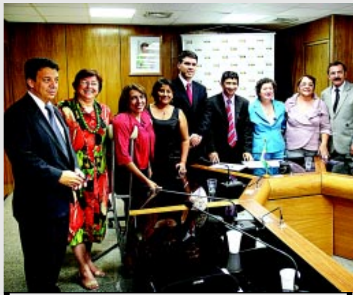
Fonseas discute e negocia as ações de assistência social do país

O Fonseas, instância de articulação política das secretarias estaduais de Assistência Social, tem como objetivos discutir e negociar as